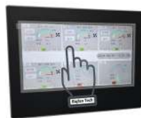
HMI 터치화면 (작동시간 제어가능)

국내 대기업 대량납품 완료제품 PMSM모터로 인해 오일교체, 과열, 소음으로부터 자유로워 질 수 있습니다.