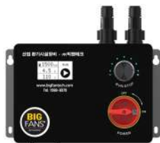
HVLS 전용인버터 (컨트롤러 IN-310)